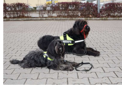
Borzas (nagy kutya) és Süti (kis kutya), a vizsgázott hangjelző kutyák